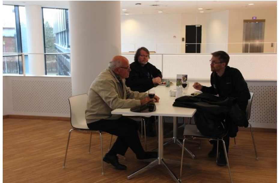
En spændende eftermiddag afslutter vi med hyggeligt networking.