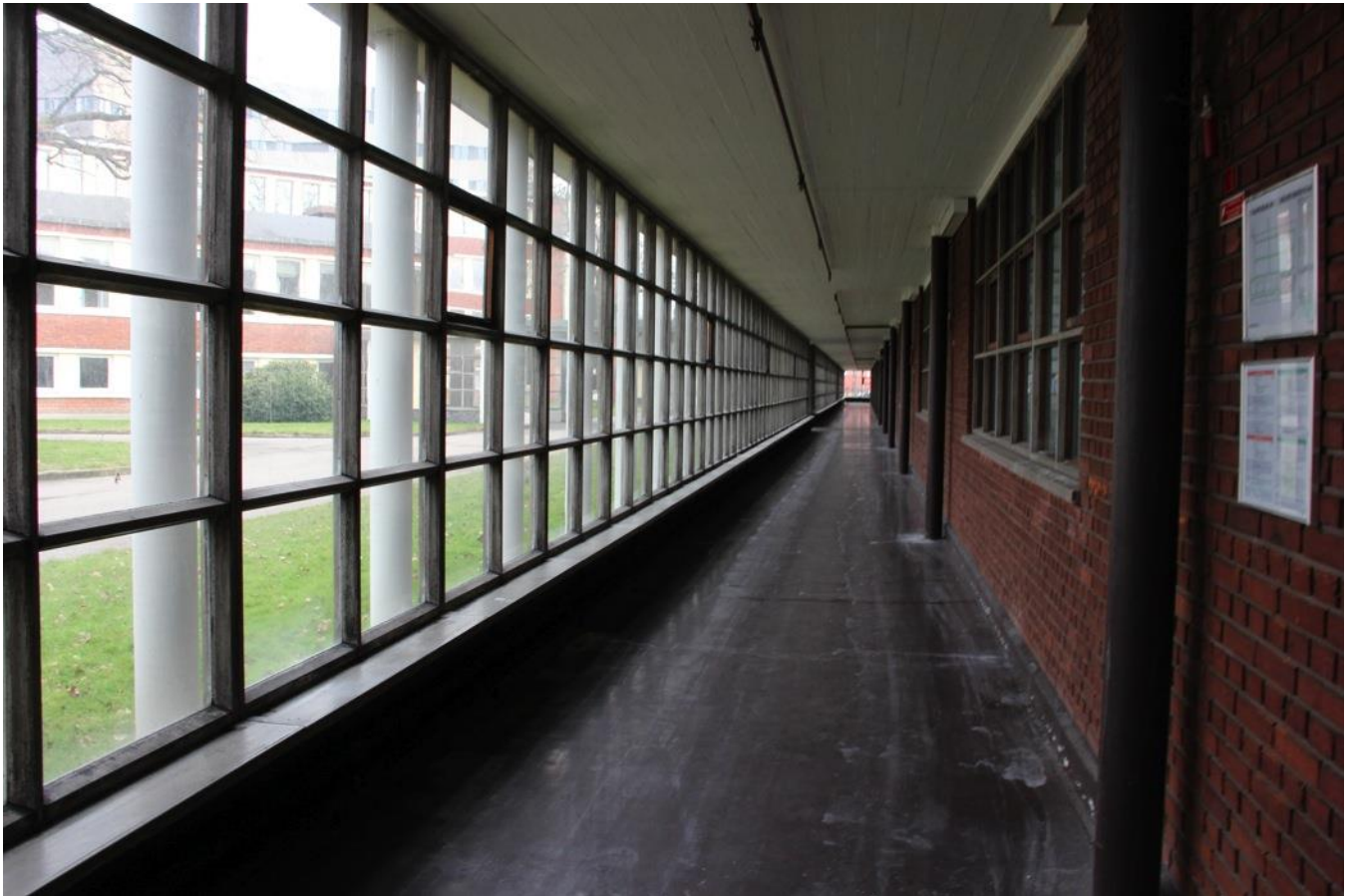
De bevaringsværdige bygninger på grunden vil blive lavet om til ungdomsboliger og ejerboliger, dagligvarebutik og fordelingscenter til Post Nord.