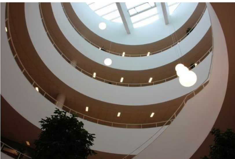
I midten af bygningen er et atrium, som fællesarealerne på hver etage går ud til.