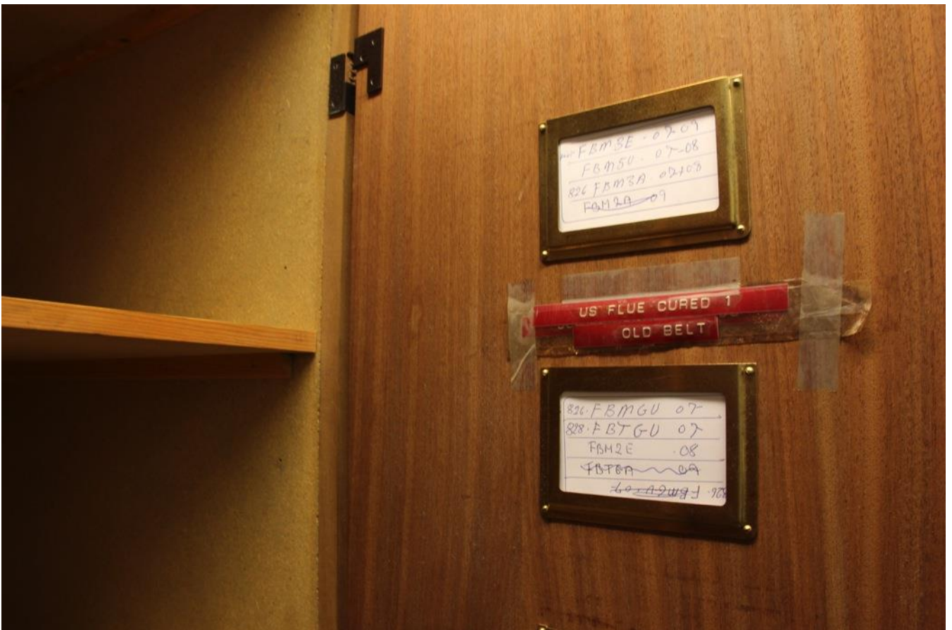
Et af skabene, hvori de forskellige slags tobakker blev opbevaret. Lugten af tobak hænger endnu ved i skabet.