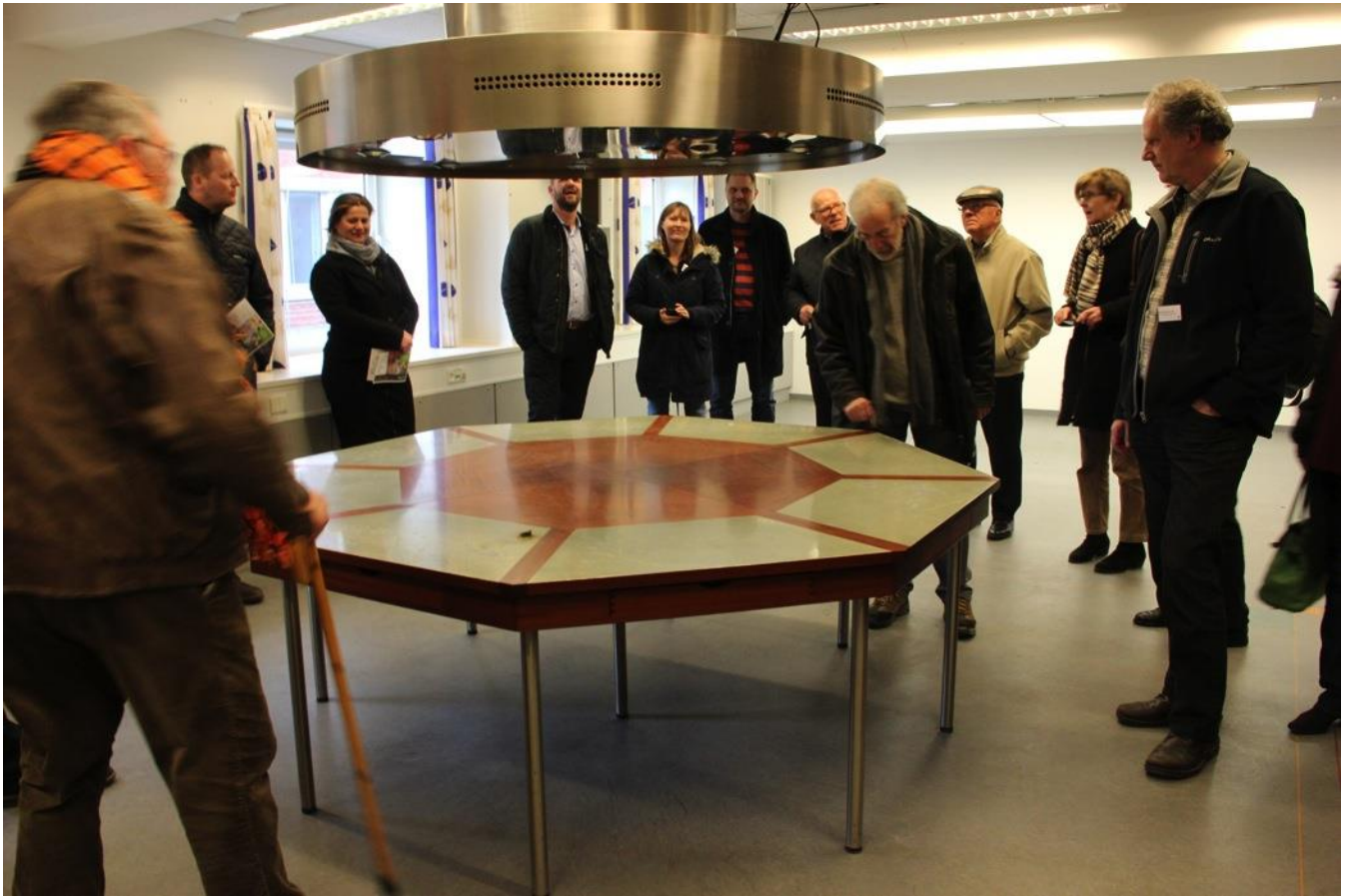
Et tidligere rygerum, hvor der ved dette bord blev prøvesmagt/røget tobak.