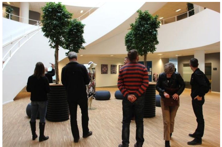
Gladsaxe Company House er 15.400 m 2 stort og er tegnet af Vilhelm Lauritzen Arkitekter og EFFEKT.