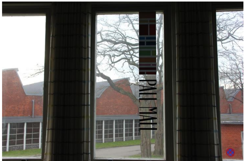
Indtil år 2011 drev Skandinavisk Tobakskompagni og British American Tobacco tobaksfabrik på grunden.