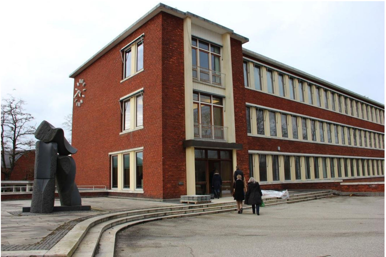
Den gamle tobaksgrund