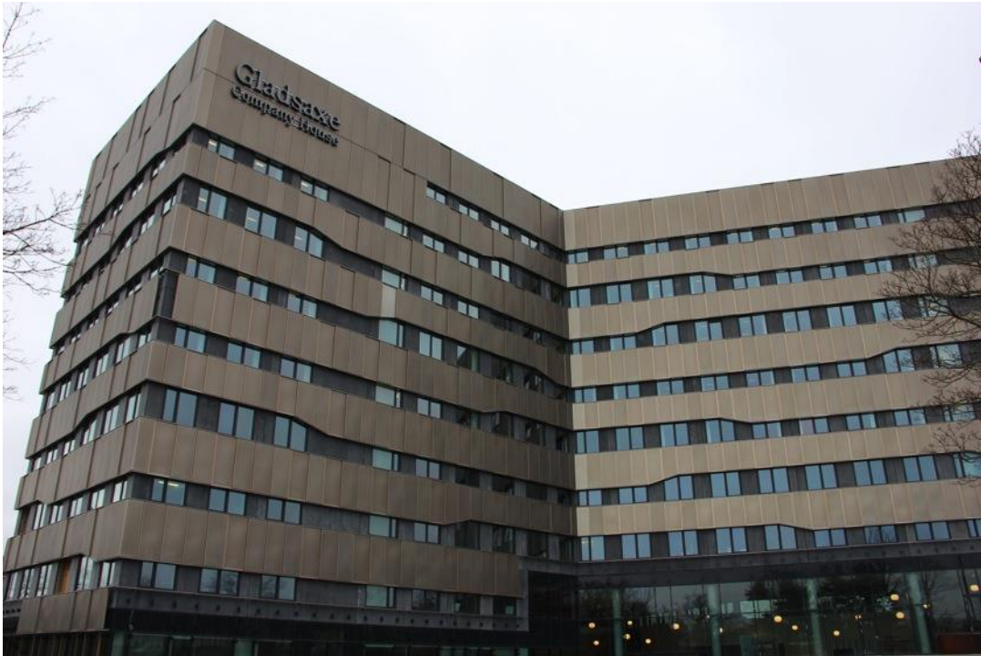
Gladsaxe Company House

Byens Netværk besøger Gladsaxe Company House, hvor vi bl.a. hører om DGNB klassificeringen, som forventes at blive guld og derudover får vi et smugkig på de gamle bygninger på den gamle tobaksgrund.