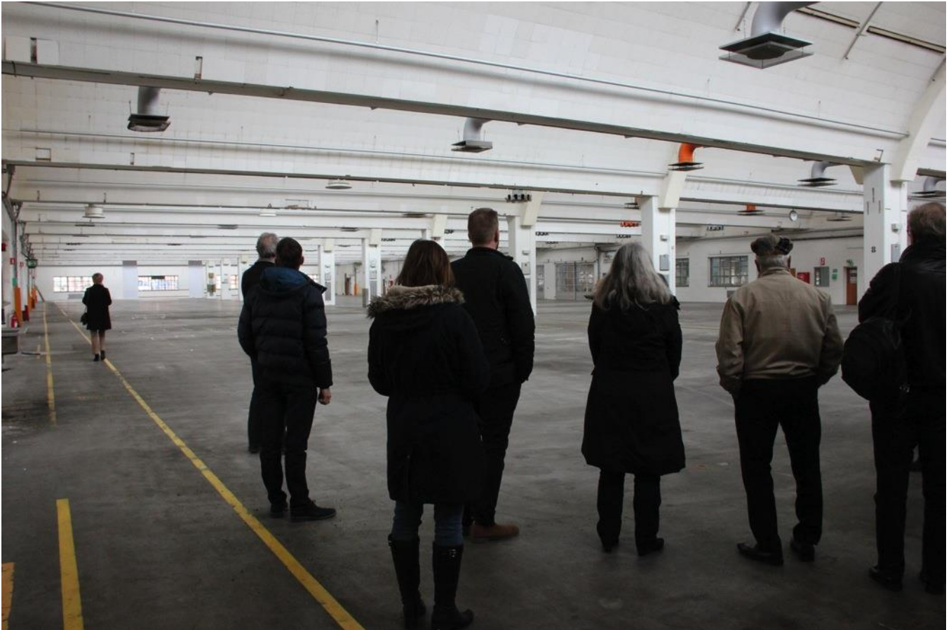
Den gamle fabriksdal