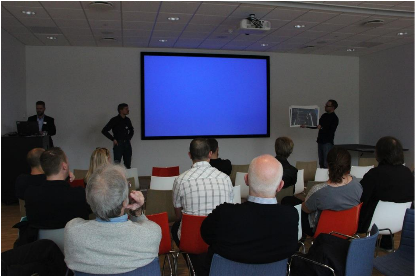
Gladsaxe Company House er indrettet til flere lejere, som har fælles faciliteter fx reception, kantine og mødelokaler.